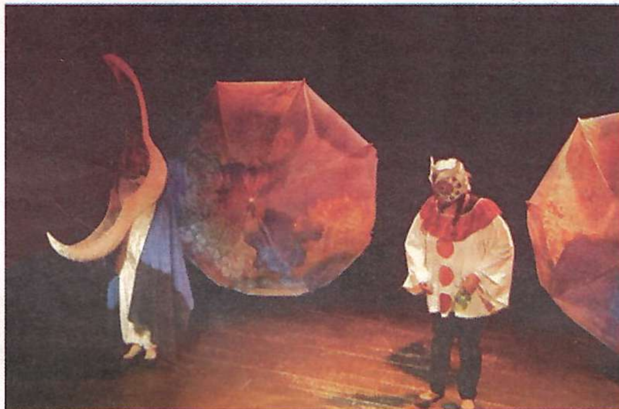
Pièce Aminata.

Et puis bien sûr, l'actualité du Versant s'annonce, comme de coutume, bien chargé en manifestations récurrentes néanmoins très créatives et pour certaines, en pleine évolution. C'est ainsi le cas de la Cité de l'Océan qui ne peut que se féliciter d'un regain salutaire de vie grâce aux interventions de la compagnie,