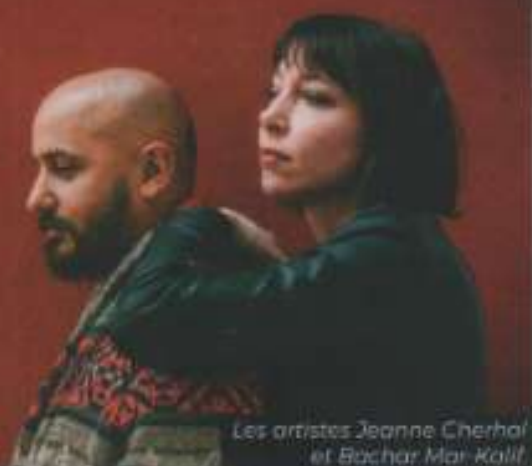
Les artistes Jeanne Cherhal et Bachar Mar-Kalif

Connectez-vous à LOOK UP POUR UNE « INFORMATION AUGMENTÉE » !