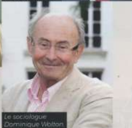
Le sociologue Dominique Wolton